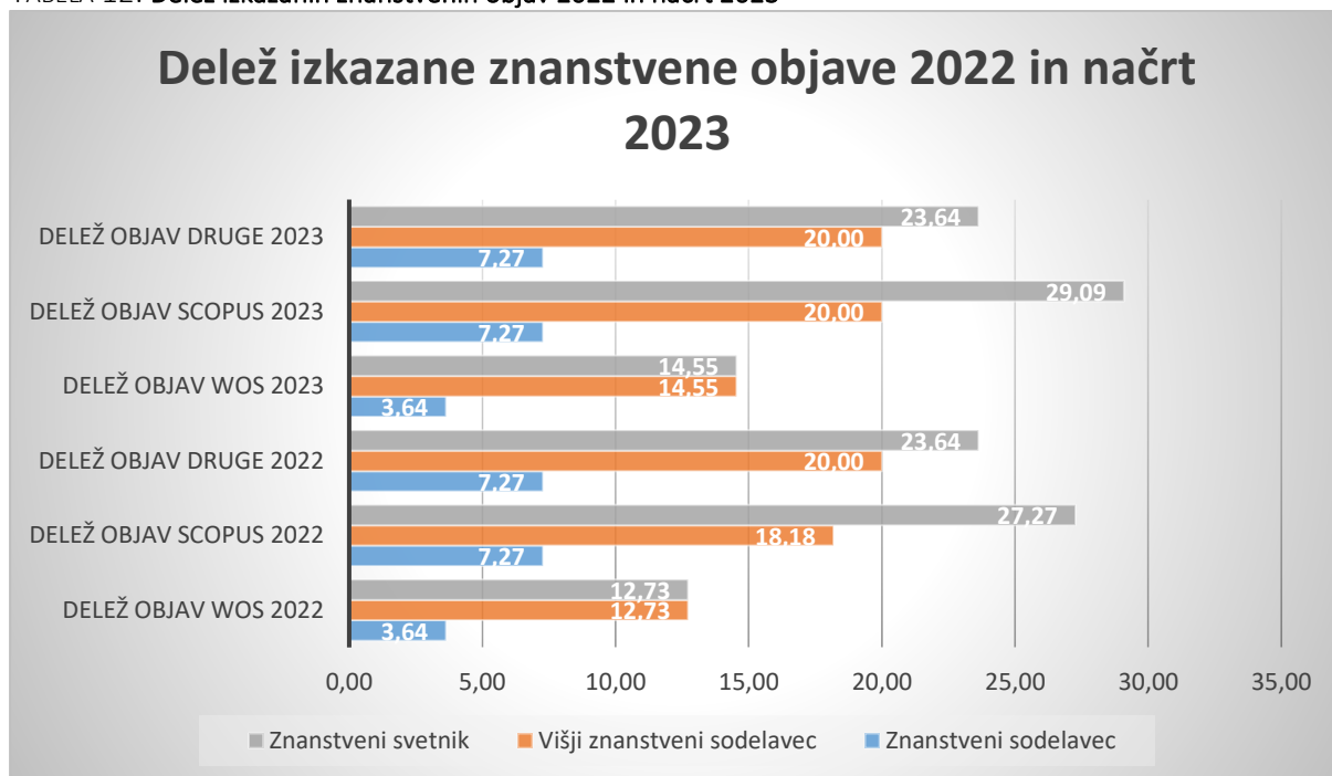
TABELA 12: Delež izkazanih znanstvenih objav 2022 in načrt 2023

Delež visokošolskih učiteljev z nazivom znanstveni sodelavec in višje, ki v letu 2022 izkazuje znanstveno objavo v WoS-u je 29,09%, v SCOPUS-u je 52,73% in v drugih zbirkah 50,91%. Delež v WoS-u se je zmanjšal, delež v SCOPUS-u in drugih zbirkah, pa se je povečal. Načrtovan delež za leto 2023 v WoS-u je 32,73%, v SCOPUS-u je 56,36% in v drugih zbirkah 50,91%.